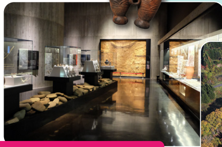
函館縄文文化交流中心